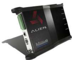
Antény Alien ALR-8610