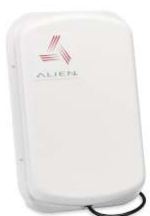
RFID tagy Alien ALN-9540